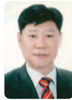
총무 강 시 명 L