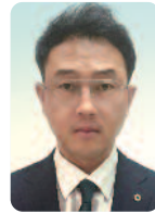
L.T 하 수 봉 L