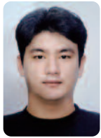
T.T 이 동 우 L