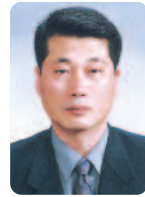
재무 이 제 희 L