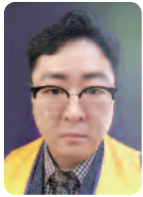
재무 이 재 광 L